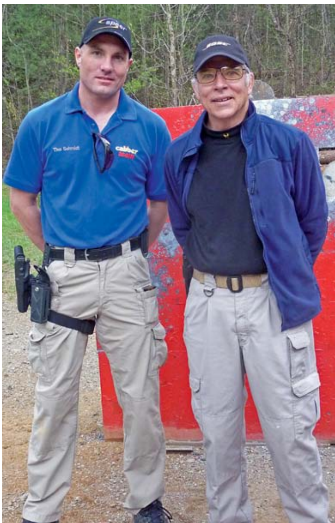
Der Autor mit Bill Rogers auf seiner legendären Schießschule in Ellijay, Georgia.

gibt es ein im Umfang verringertes Putzset, das auf die hier am häufigsten Kaliber zurechtgestutzt wurde. Das Reinigungsset, das in jeder „Range Bag“ Platz findet, besteht aus einem zweiteiligen Drahtseil, dessen Enden sich verschrauben lassen, woraus eine maximale Gesamtlänge von rund 85 Zentimeter resultiert. Somit lassen sich Läufe von Kurz- und Langwaffen säubern. Die dazu passenden Phosphor-Bronze-Bürsten sind für die Kaliber 5,6 mm, 7,62 mm und 9 mm eingerichtet. Herzstücke des Systems sind die orangefarbenen, leicht übermaßigen „SqueegE“ Gummipins, die anstatt eines Baumwollpatches die Reinigungsflüssigkeit aus dem Lauf wischen. Unterwegs und für die